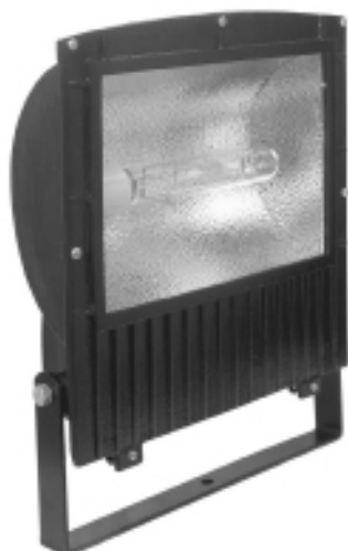
FOTO ILUSTRATIVA SBE-434/400 E-40

Aplicação: Fachadas, jardins, monumentos e quadras poli esportivas.