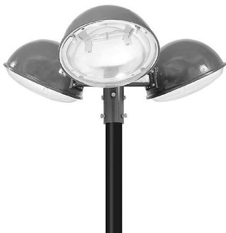
FOTO ILUSTRATIVA 3 x SBD-234 SUPORTE SBS-234/3 E POSTE SBP-850/1

Aplicação: Área externa de shopping center, jardins, parques, universidades, praças públicas, etc.