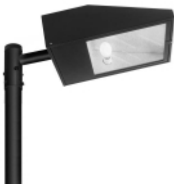
FOTO ILUSTRATIVA SBD-226-M SUPORTE SBS-226-G/1 E POSTE SBP-850/1

Aplicação: Área externa de shopping center, jardins, parques, universidades, praças públicas, etc.