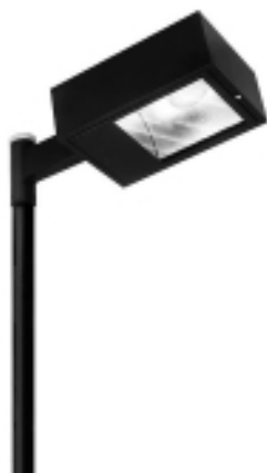
FOTO ILUSTRATIVA SBD-224 SUPORTE SBS-224-P/1 E POSTE SBP-850/1

Aplicação: Área externa de shopping center, jardins, parques, universidades, praças públicas, etc.