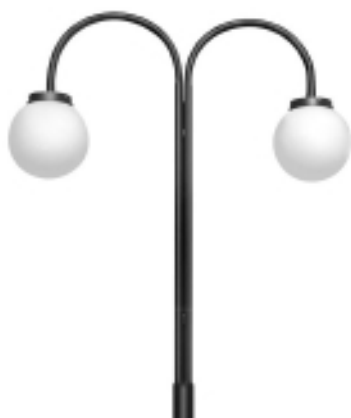
FOTO ILUSTRATIVA 2 x SBD-222 E POSTE SBP-854/2

Aplicação: Área externa de shopping center, jardins, parques, universidades, praças públicas, etc.