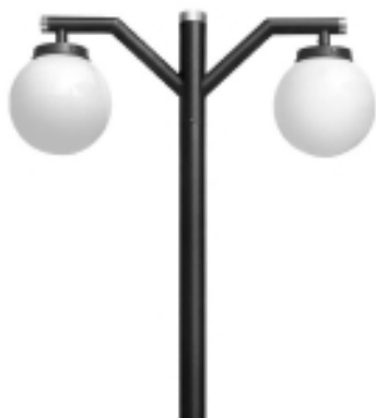
FOTO ILUSTRATIVA 2 x SBD-220 E POSTE SBP-853/2

Aplicação: Área externa de shopping center, jardins, parques, universidades, praças públicas, etc.