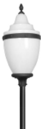
FOTO ILUSTRATIVA SBD-208-M E POSTE SBP-850/1

Aplicação: Área externa de shopping center, jardins, parques, universidades, praças públicas, etc.