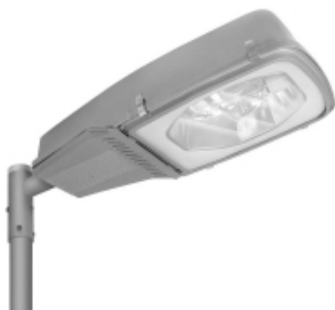
FOTO ILUSTRATIVA SB-142/400 SUPORTE SBS-925/1 E POSTE SBP-800

Aplicação: Ruas, avenidas, viadutos, praças, jardins, pátios, áreas externas industriais, postos de serviços, etc.