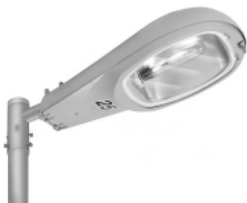
FOTO ILUSTRATIVA SB-121/250 SUPORTE SBS-925/1 E POSTE SBP-800

Aplicação: Ruas, avenidas, viadutos, praças, jardins, pátios, áreas externas industriais, postos de serviços, etc.